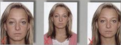
za duża głowa za mała głowa nie skadrowana

2. Format zdjęcia - szerokość 35mm, wysokość 45mm. Obraz na zdjęciu musi pokazywać całą głowę i górną część szyi, prawa i lewa strona twarzy musi być dobrze widoczna. Wysokość głowy musi zajmować 70-80% zdjęcia, tj. 31-36mm. Przy dużej objętościowo ilości włosów należy zwrócić uwagę, aby głowa była w pełni odwzorowana, przy założeniu, że wymiar twarzy nie będzie pomniejszony (część fryzury może znaleźć się poza kadrem). Wysokość twarzy nie może być mniejsza niż 31mm. Oczy powinny znajdować się na wysokości 20-30mm od dolnej krawędzi zdjęcia, w przypadku dzieci (do 11. roku życia) dolna granica może zostać przesunięta do 15mm. Twarz musi znajdować się w osi pionowej zdjęcia.