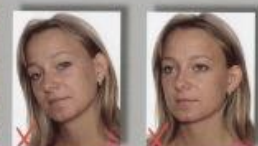
przekrzywiona głowa półprofil

3. Pozycja głowy i wygląd twarzy - zdjęcie musi pokazywać front osoby fotografowanej z twarzą skierowaną prosto w obiektyw aparatu. Osoba fotografowana musi mieć wygląd twarzy naturalny z zamkniętymi ustami.